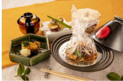
和食ダイニング「厨房」