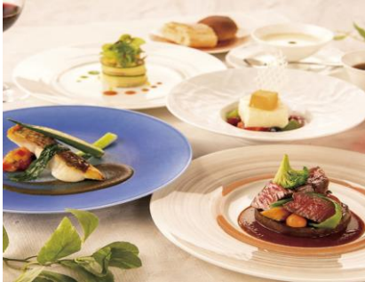
カジュアルダイニング「ウルバーノ」